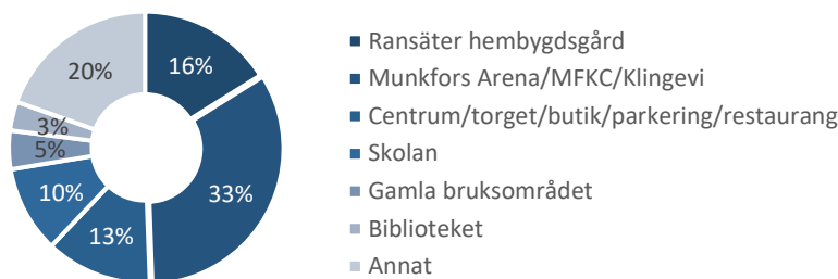
Figur 2: Mötesplatser

”Bra fritidsaktiviteter med padel, discgolf, fotbollsplaner, ishall, sporthall mm. Även fin natur med bra stigar, elljusbana mm. MFKC (gamla Folkets Hus) är också en viktig del i lägerverksamhet, pub, bi o, revy, konferenser, boende i stugbyn mm. Munkfors bästa plats!”